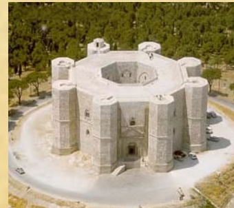
Castel del Monte, Pouilles